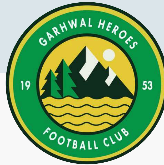
Garhwal Heroes FC