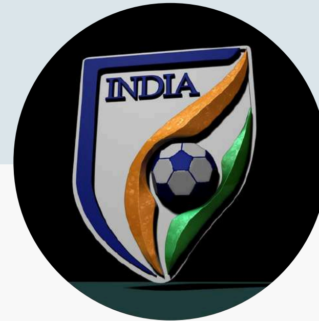
Football Trials India

Target Audience: ~DU Students ~College Youth